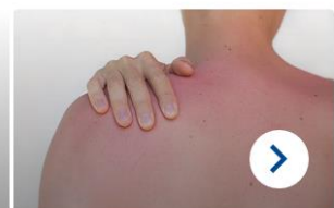
Sechs falsche Annahmen, die Hautkrebs nicht verhindern können

Starten Sie vorbereitet in den Frühling: